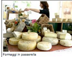
Formaggi in passerella

Se a maggio vi trovate nelle Marche e siete golosi di tomini, mozzarelle e provole segnatvi l'appuntamento con "Formaggi d'autore", la tredicesima edizione della mostra mercato dedicata alla tradizione casearia italiana in programma a Gualdo, piccolo borgo medievale a circa quaranta chilometri da Macerata. La rassegna durerà una fine settimana, sabato 23 e domenica 24 maggio, ed è promossa dall'Associazione Gualdo