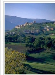
Veduta di Gualdo. Il borgo si trova tra le valli dei torrenti Tennacola e Salino

Oltre ai formaggi freschi, agli erborinati, come il gorgonzola, e alle forme stagionate, ci saranno esemplari tutelati dai Presidi italiani Slow Food per la valorizzazione di prodotti fatti con latte crudo di pecora: è il caso dei Formaggi di malga Béarn preparati dai pastori sul versante francese dei Pirenei Occidentali; la Provola dei Nebrodi, un caciocavallo prodotto dai casari dei monti della Sicilia; la Provola delle Madonie e la Vestreda del Belice, l'unico formaggio di pecora a pasta filata.